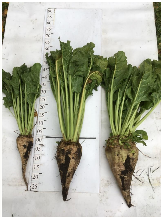
Рис. 2. Сахарная свекла, выращенная в ООО «Нерал-Буздяк» (слева направо: неорошаемая, орошаемая, рекордная орошаемая)

По данным бухгалтерской отчетности ООО «Нерал-Буздяк» урожайность сахарной свеклы на орошаемых полях №11и №12 составила 815 ц/га, на орошаемых полях №9 и №10 – 764 ц/га, а на неорошаемых полях – 453 ц/га. Данные биологической урожайности выше, чем урожайность, полученная в результате сплошной уборки механизированным способом, т.к. в этом случае неизбежны потери урожая, величина которых может составлять 10-20% биологической урожайности [7].